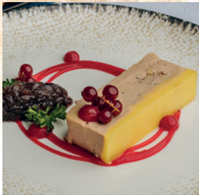
Libamáj terrine, lilahagymalekvár, ribizli-coulis, pirított kalács