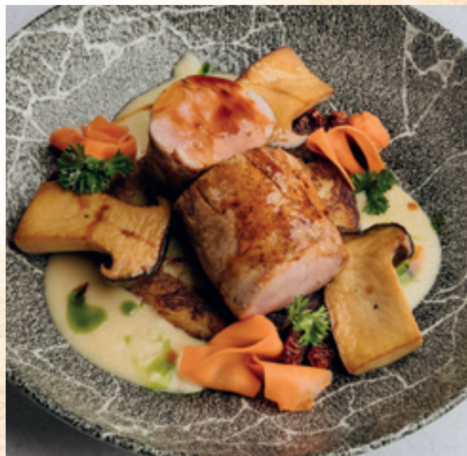
Omlós sertésszűz, dödőlle, marinált sárgarépa, salottahagyma-krém, ördögsekér gomba