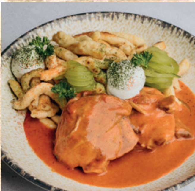
Csirkepaprikás, spätzle, tejföl, savanyított uborka