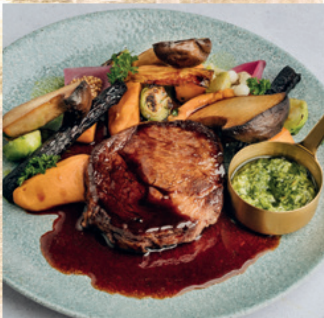
Rib-eye steak, édesburgonya-püré, ördögsekér gomba, színes répák, chimichurri