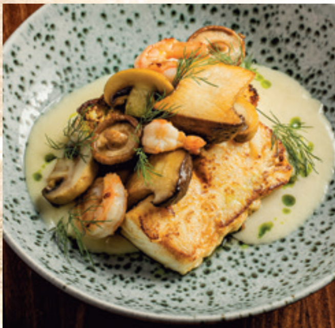
Tőkehalfilé Kárpáti módra, sült polenta, grillezett tigrisrák, pirított gombák