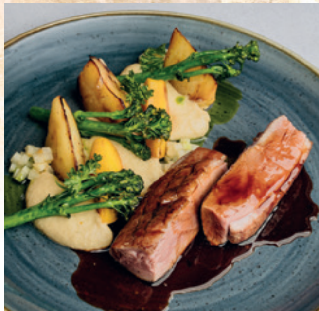
Rosé kacsamell, zeller variációk, vad brokkoli, grillezett sárgabarack