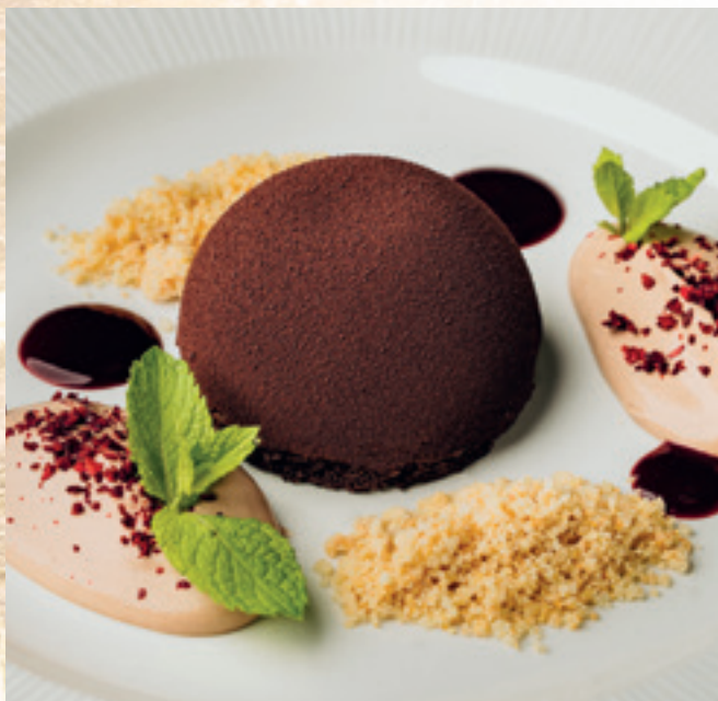
Málnás étcsokoládémousse feketeszeder-coulis-val mandulás morzsával