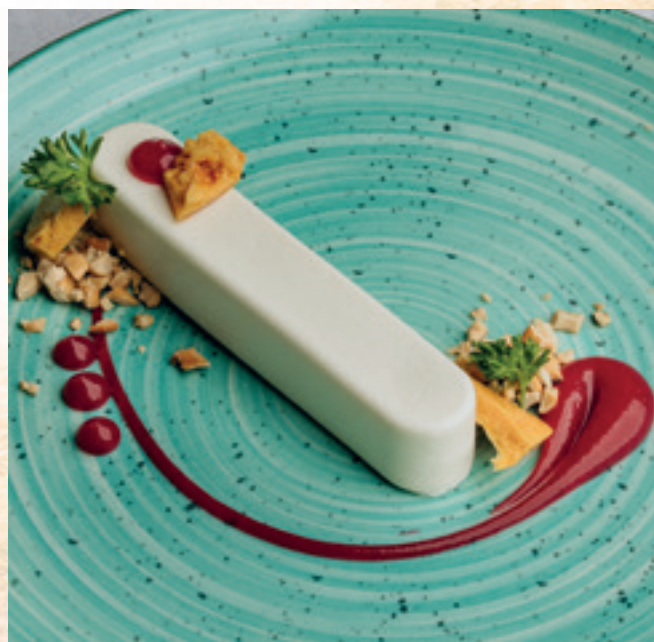
Kecskesajtmousse, törökmandula, málnapüré