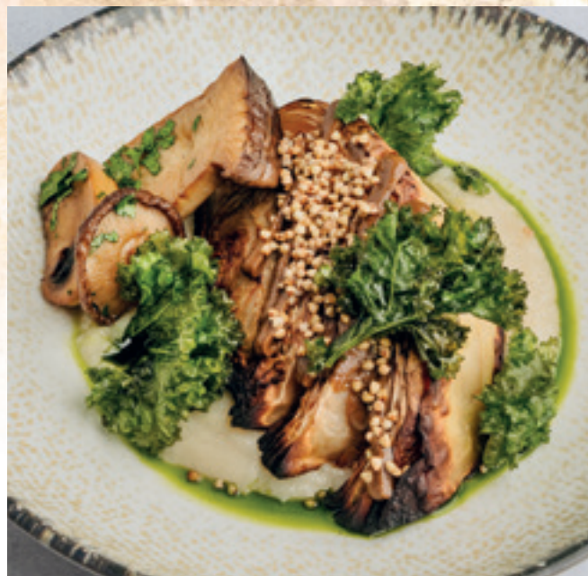
Vegán misos sült káposzta, gombaketchup, pirított gombák, hajdina, ropogós fodroskel