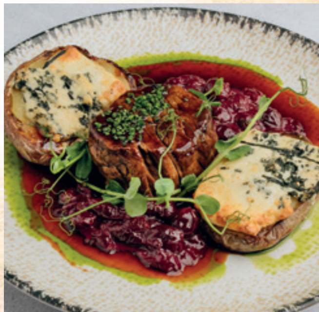
Bélszínsteak, kéksajtos töltött sült burgonya, szikkasztott meggy mártás, tárkonyolaj