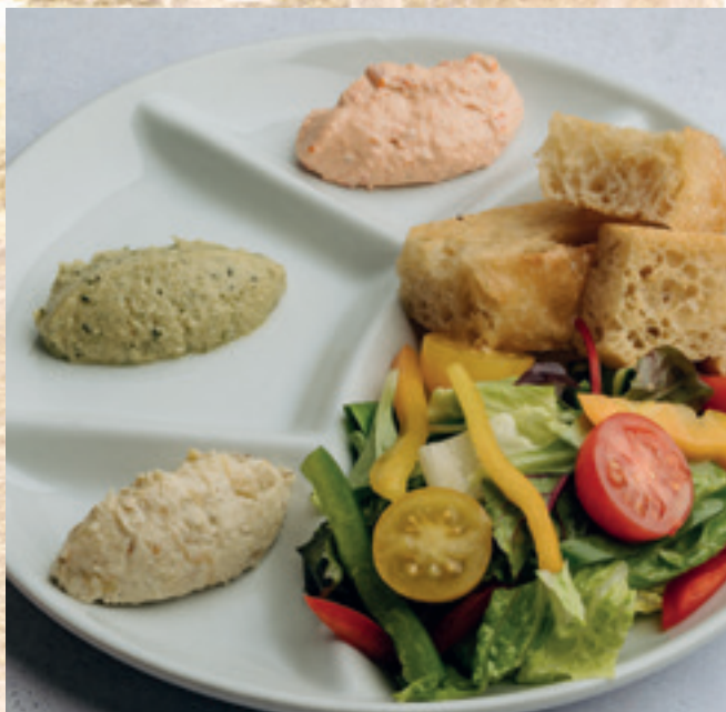
VígVarjú kenegetők: füstölt padlizsánkrém, zöldpesztós humusz, paradicsomos kecskesajt-labneh