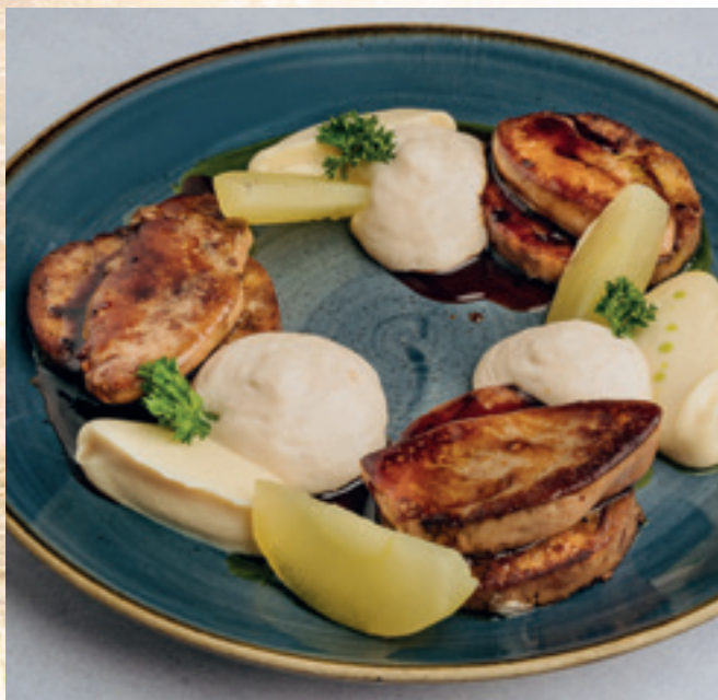
Libamáj roston, kalács felfújt, tonkabab-espuma, zöldalma