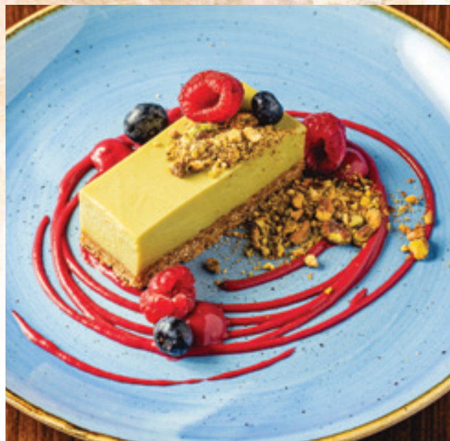
Pisztáciás sajtorta, málna