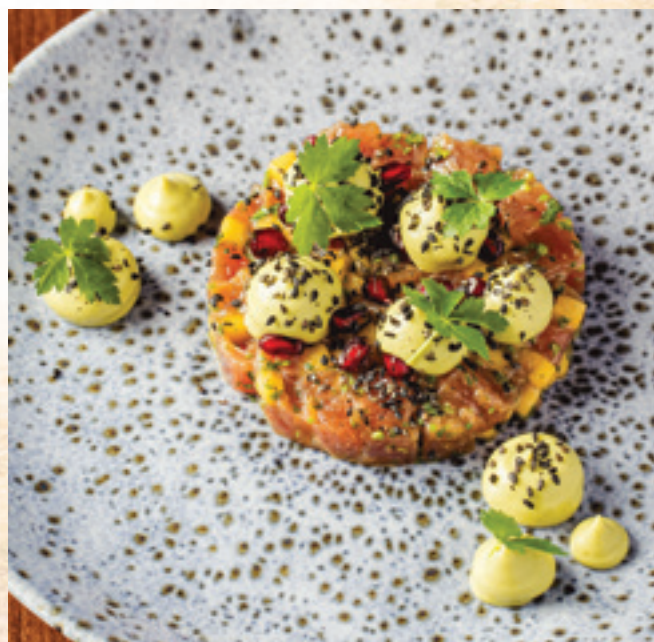
Tonhalcevice, miso-dresszing, mangó, avokádó, koriander, fekete szezámm