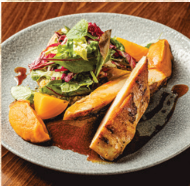
Grillezett bőrös cajun csirkemell, zöldséges quinoa, kókusztejes sárgarépa krém, radicchio, marinált sárga cékla