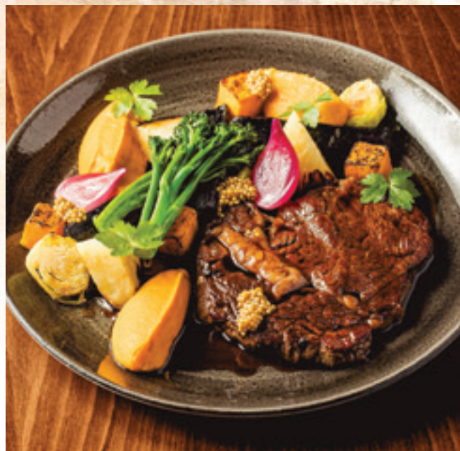
Rib-eye steak édesburgonyapürével, szezonális sült zöldségek