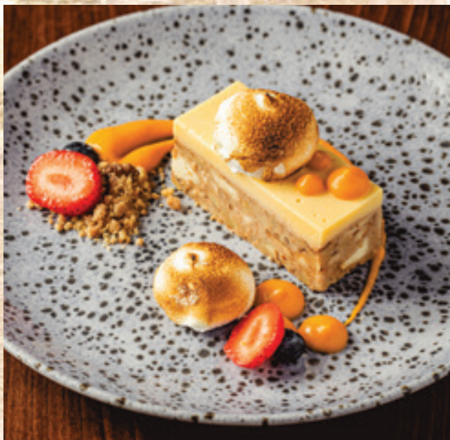
Diós guba, angolkrém, homoktövis