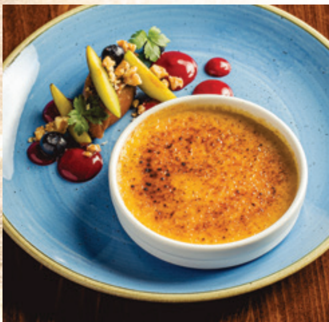
Libamáj brülée, fügechutney, szilva, dió