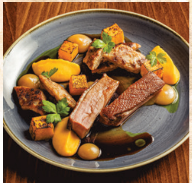
Rosé kacsamell sütőtökkel, gesztenyés nudli, birsalma-coulis, narancsos hoisin jus