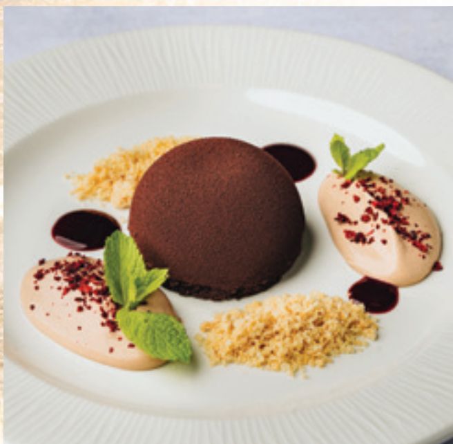
Mandarinos étcsokoládémousse, feketeszeder-coulis, mandulás morzsa