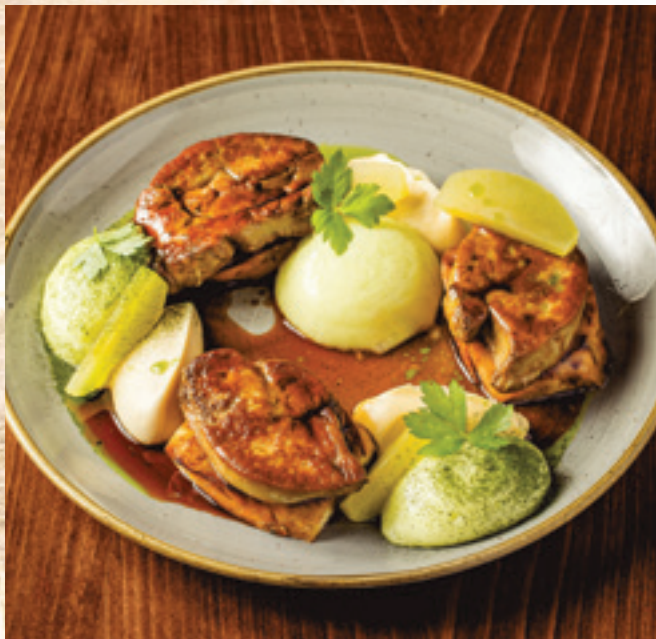
Roston sült hizott libamáj, kalácspuding, fahéjas zellerpüré, zöldalmák, petrezselyem