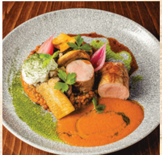
Omlós sertésszűz, bakonyi mártás, tarhonya, pirított gombák, tejföl, bacon chips