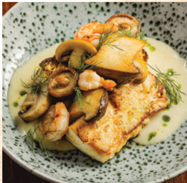
Tőkehalfilé kárpáti módra sült polentával, grillezett tigrisrák, pirított gombák