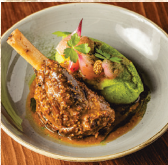
Konfitált báránycsülök, petrezselymes burgonyapüré, dijoni mustáros jus, mogoróhagyma