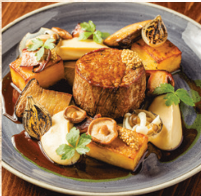
Bélszínsteak, fondant burgonya, fokhagymakrém, pirított erdei gombák, égetett hagyma