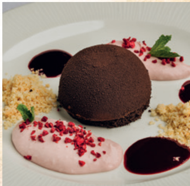
Málnás étcsokoládémousse feketeszeder-coulis-val mandulás morzsával