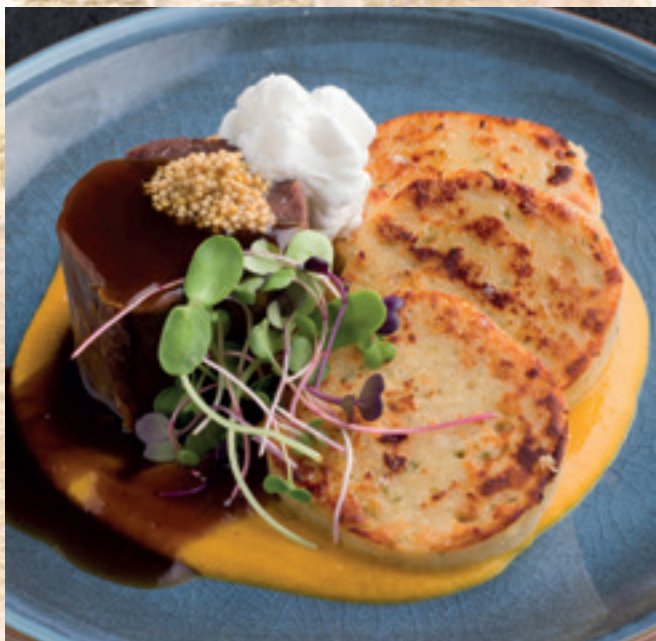
Konfitált marhanyak vadasan, házi szalvétagombóccal és tejfölhabbal