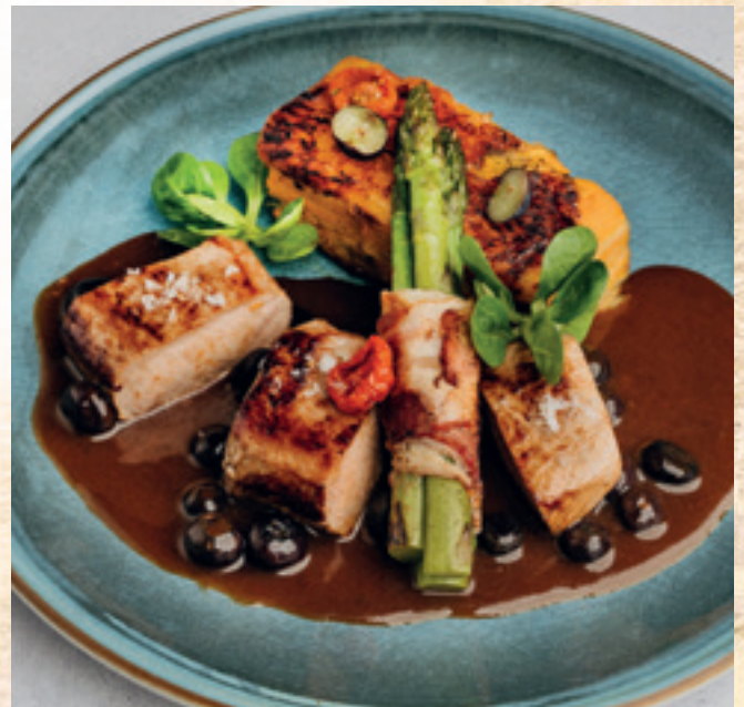
Kímélve sült vaddisznógerine édesburgonya gratinnal, baconba tekert zöldspárgával és áfonyás pecsenyeszafittal