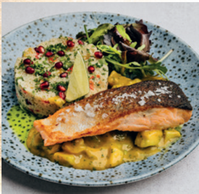
Grillezett lazacderék gránátalmás kuskusz salátával avokádós mangó salsával