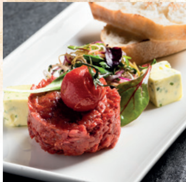
VarjúPapa tatárbeefsteakje friss zöldségekkel, vadkovászos házi kenyérrel