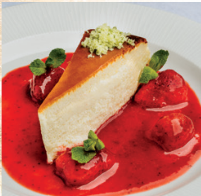
Baszk sajtorta eperraguval