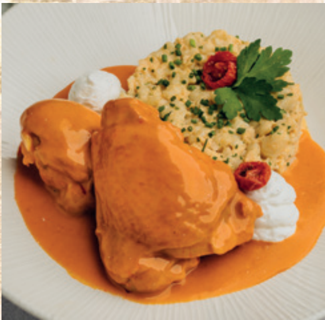
Csirkepaprikás tojasos galuskával, tejfölhabbal, szívсалátával és ecetes dresszingsel