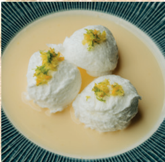
Madártej citrusos hablabdákkal