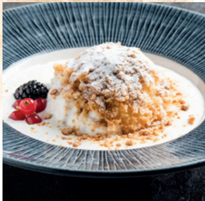
Túrógombóc puszedlis tejföllel