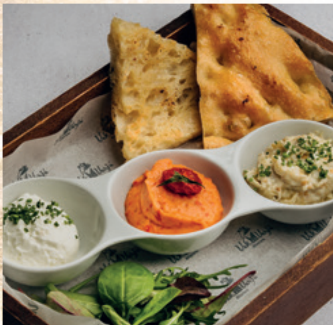
VakVarjú csipentés házi focacciával, erdélyi padlizsánkrém, kápiapaprikás humusz, lágy kecskesajtkrém