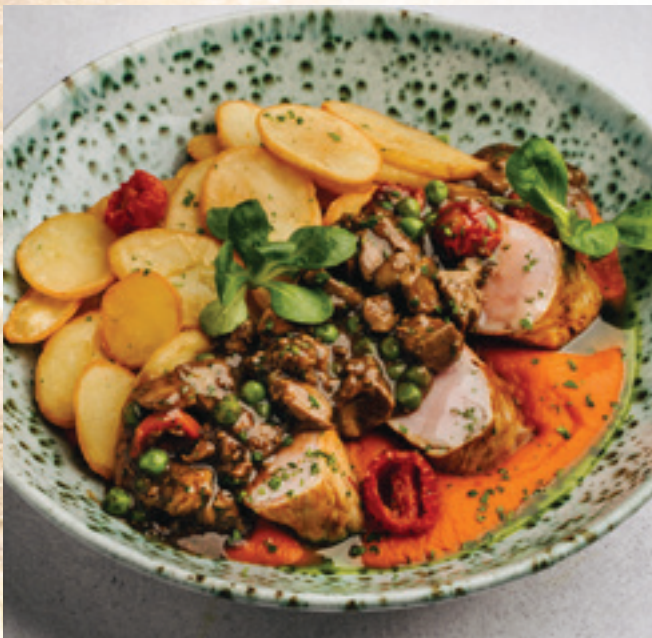
Érlelt sonkával bordírozott szűzderék lecsókrémmel, zöldborsós kacsamájraguval és chips burgonyával