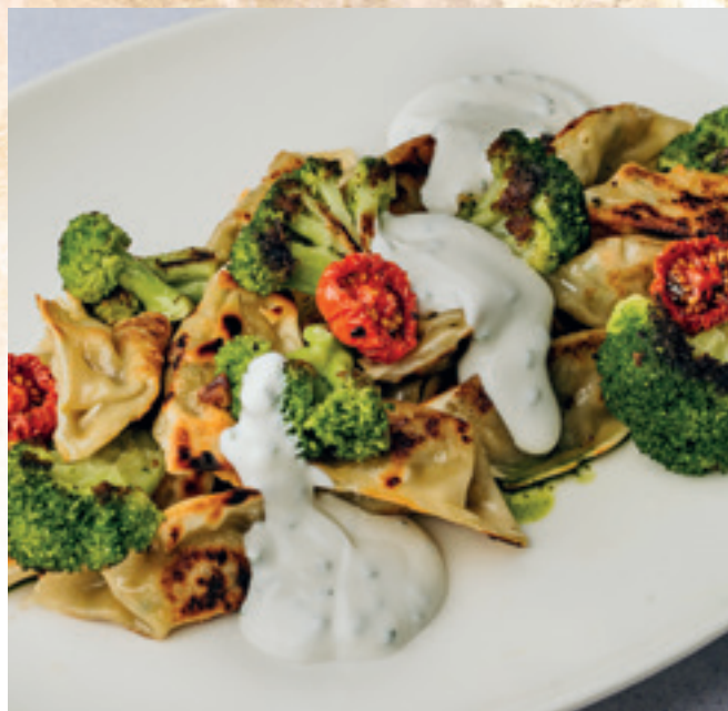
Zöldséges pelmenyi snidlinges tejföllel és sült brokkolival