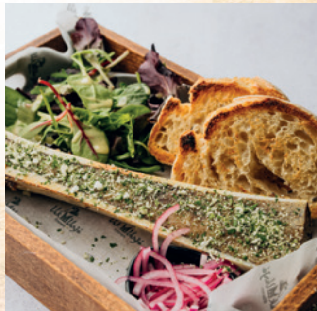
Kemencében sült velőscsont zöldfűszeres morzsával, pirítóssal és savanyított lilahagymával