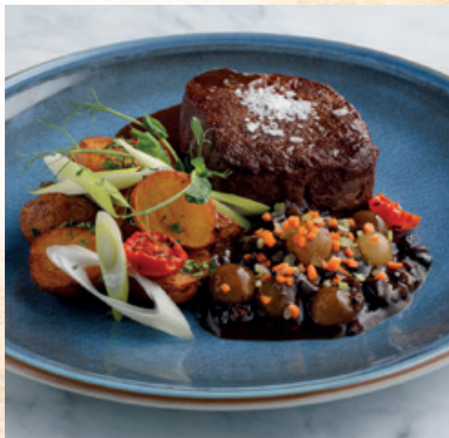
Béliszínsteak bourguignon-mártással, parmezános parászburgonyával