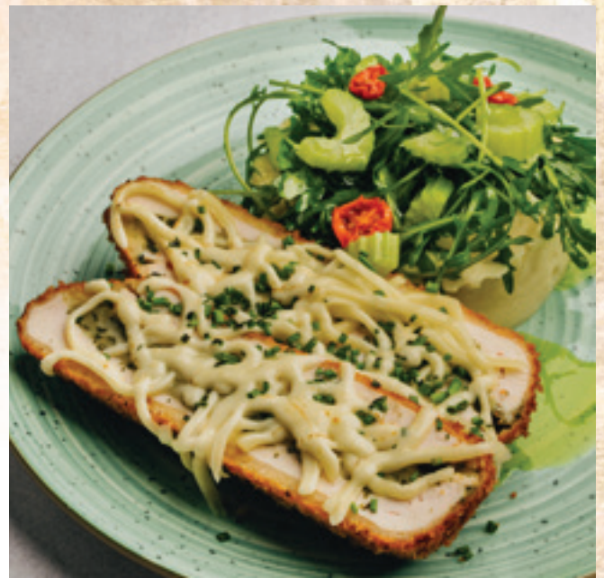
Kijevi jércemell sült zelleres burgonyapürével citrusos rukkola-salátával