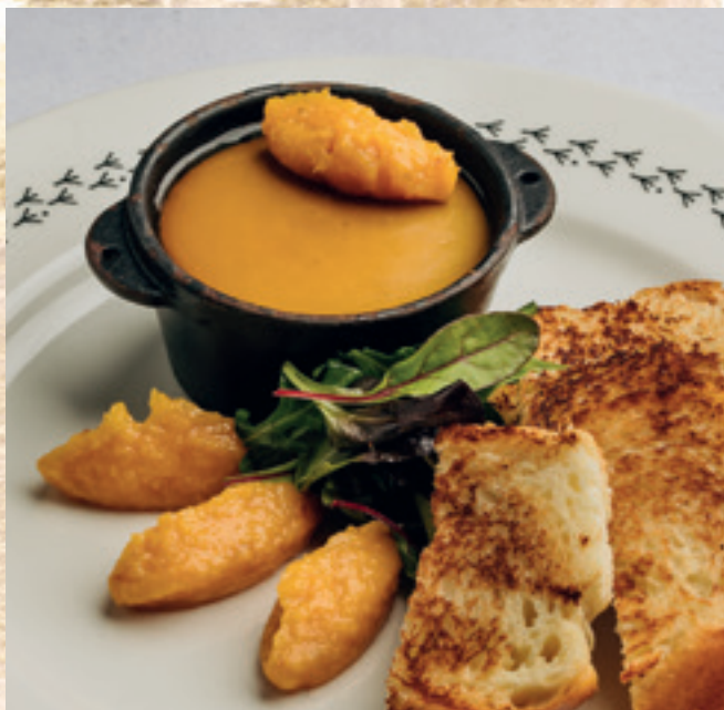
Kacsamájmouse bodzazselé alatt, barackchutney-val és kaláccsal