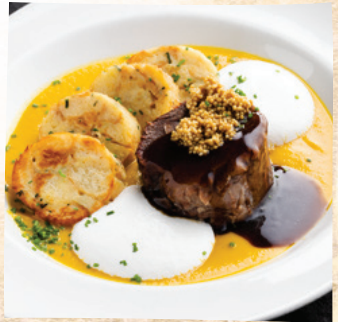
Konfitált marhanyak vadasan, házi szalvétagombóccal és tejfölhabbal