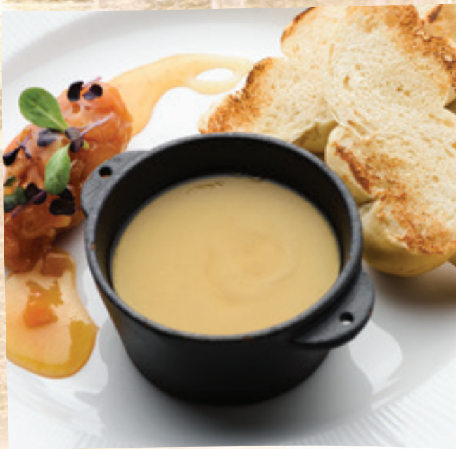
Kacsamájmosse bodzazselével, kajsziarack chutney-val és pirított kaláccsal