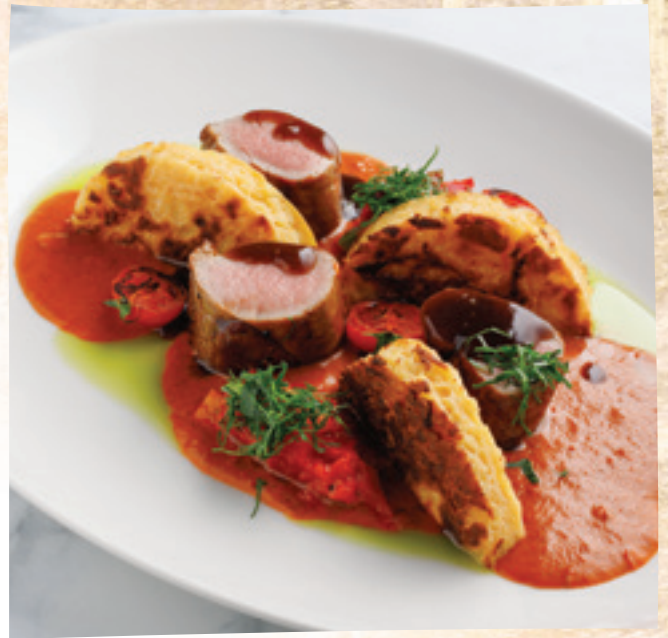
Ornlós szűzderék lecsópürével, paprikasalsával és burgonyaprószával