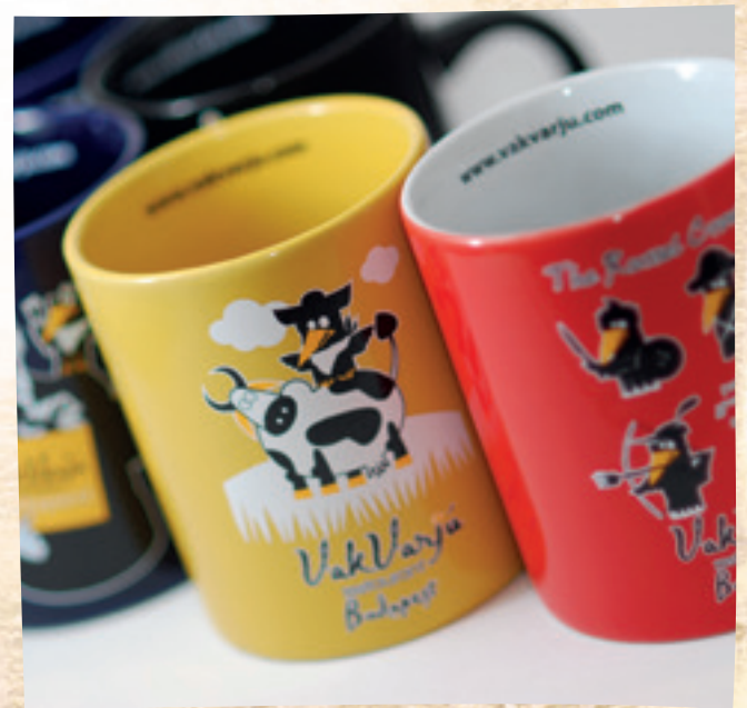
VakVarjú bögre: 2 890 Ft/db