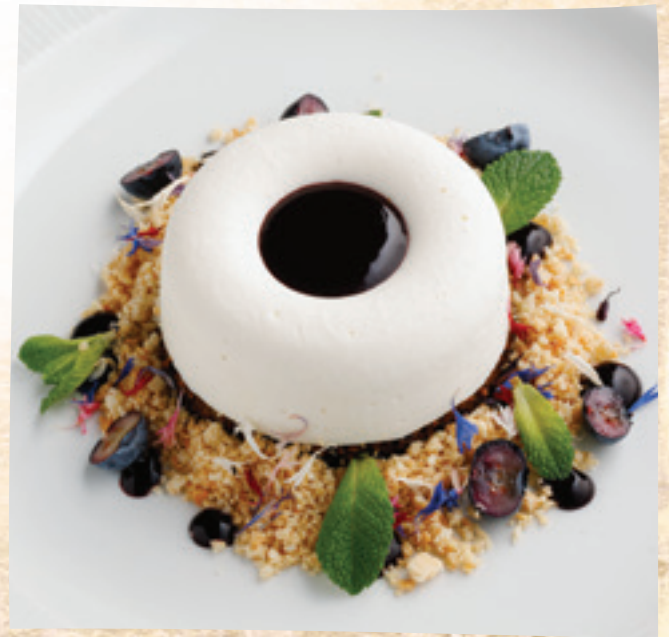
Joghurthabos citromtorta áfonyaöntettel