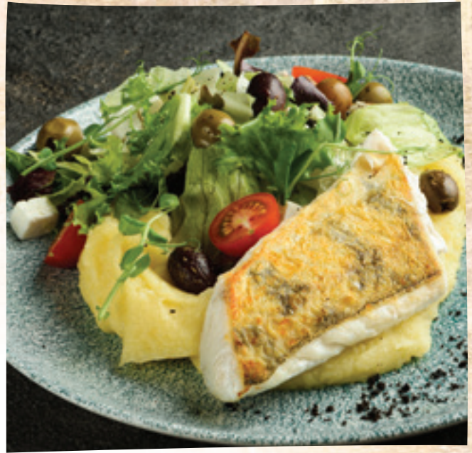
Lávakövön sült fogasfilé skordáliával és fetás szőlősalátával