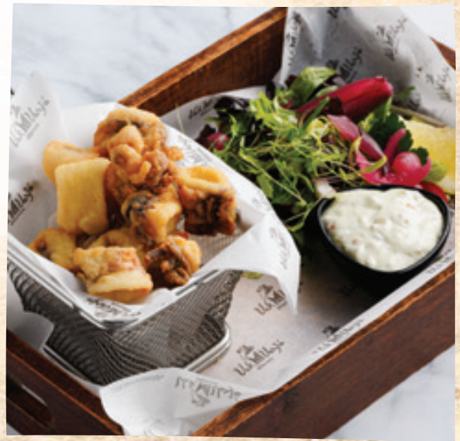
Calamari fritti zöldalmás remuláddal, marinált hagymával