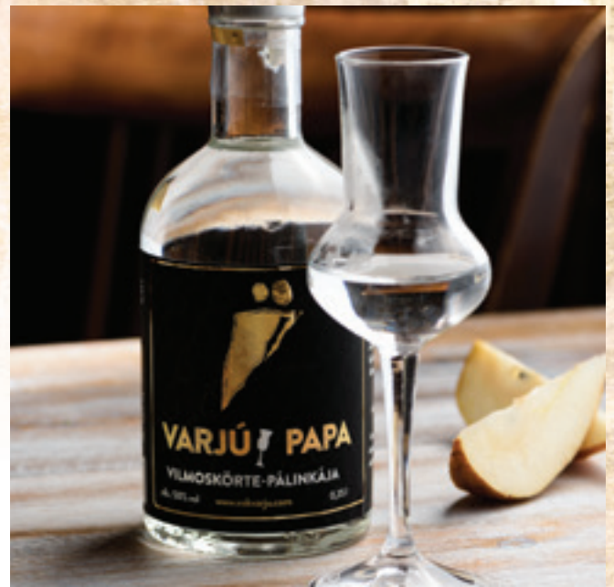
VarjúPapa pálinkája: 6 890 Ft/palack/elvitel