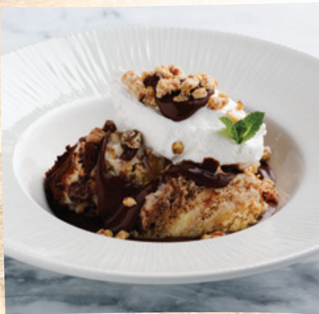
VakVarjú klasszik somlói galuska