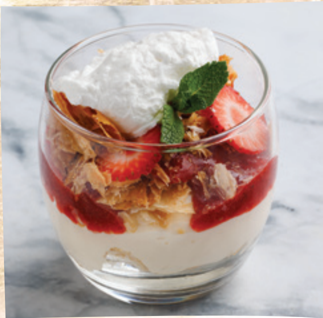
„Mille Feuille” pohárdesszert eperraguval