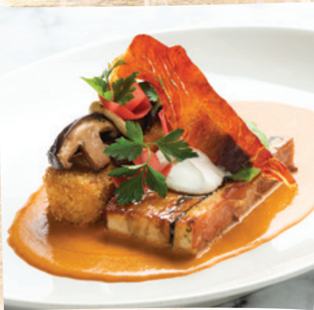
Bakonyi préselt csirke pirított shiitake gombával és ropogós bundában sült juhtúrós sztrapacskával