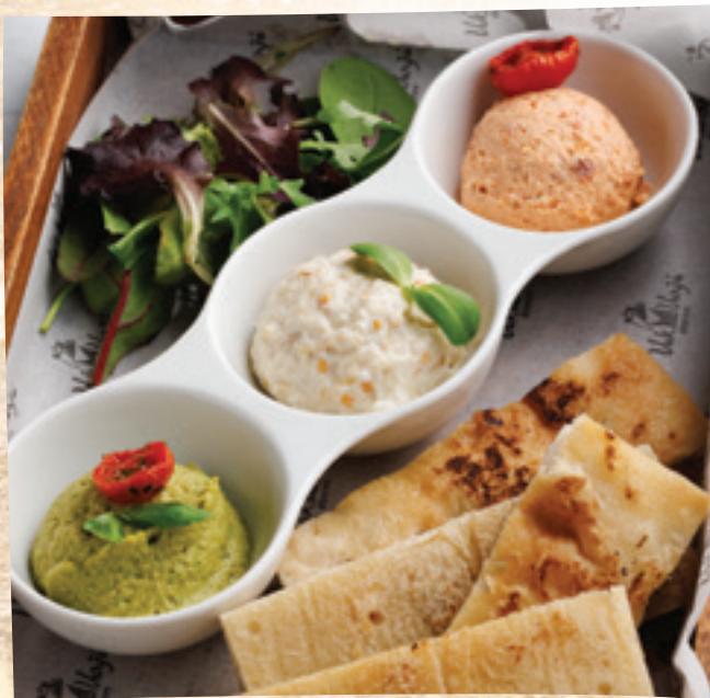
VakVarjú csipontés házi focaccia-val: erdélyi padlizsánkrém, aszalt paradicsomos kecskesajt, bazsalikompestós hummusz