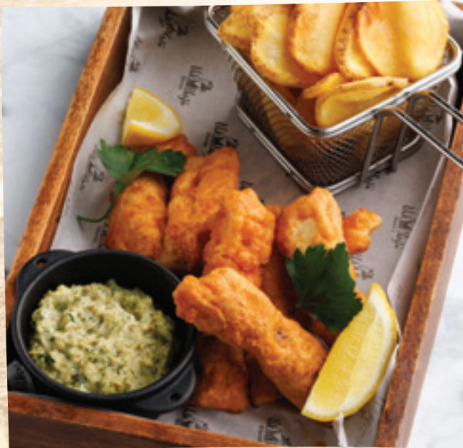
Hekk & Chips kovászosborka-remuláddal