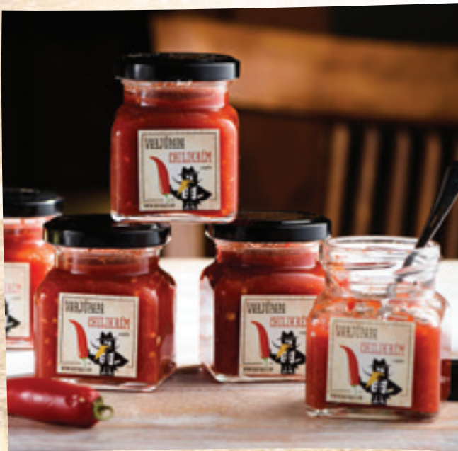
VarjúPapa chilikrém: 1 990 Ft/db