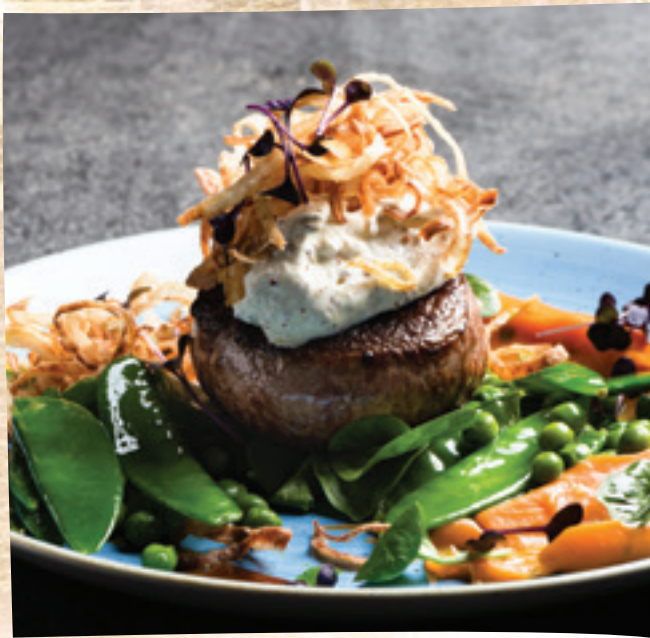
Bélszínsteak mustármagos krémsajttal, lyoni hagymával, édesburgonyakrémmel és cukorborsóval