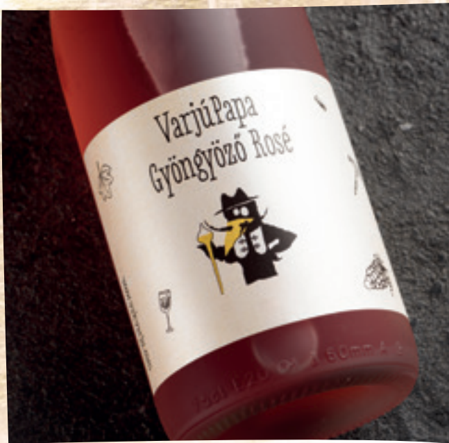
VarjúPapa rosé: 4 290 Ft/palack/elvitel