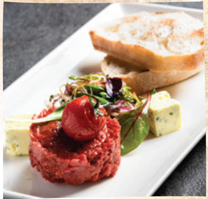
VarjúPapa tatárbeefsteak színes hagymasalátával, vadkovászos házi kenyérrrel