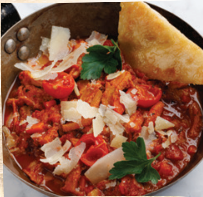
Firenzei paradicsomos pacal parmezánnal és foccacia-val