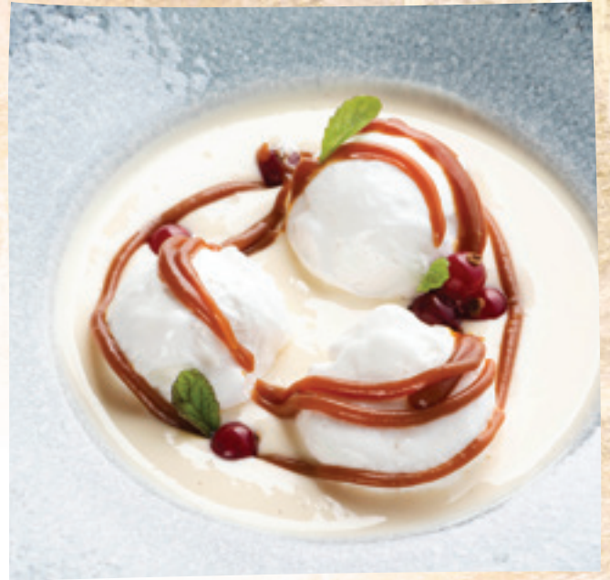
Madártej karamellás hablabdával