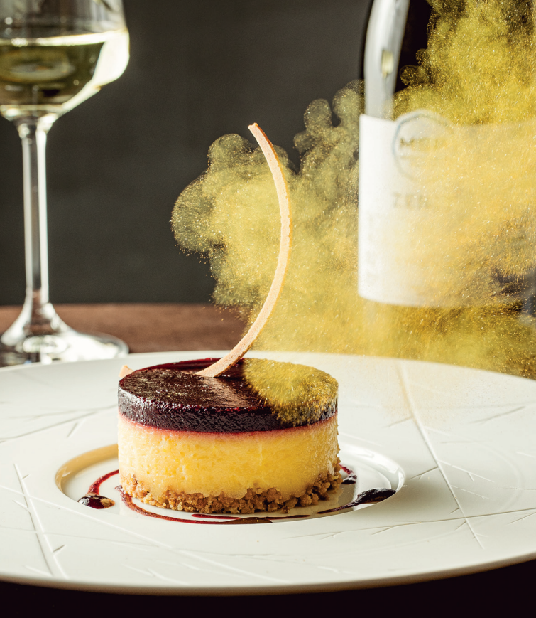
Citromtorta cseresznye coulis-val és must sorbet-val Lemon cake with cherry coulis & must sorbet