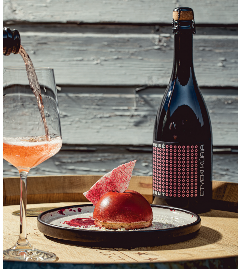
Málnás ruby csokoládé mousse vörösáfonyás piskótával Raspberry ruby chocolate mousse with cranberry sponge cake